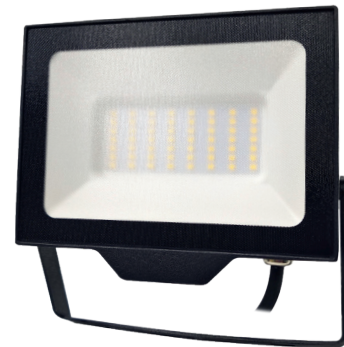
DAISY BETA 50W