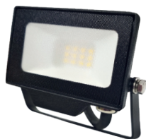
DAISY BETA 10W