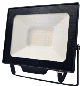
DAISY BETA 30W