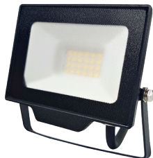
DAISY BETA 20W